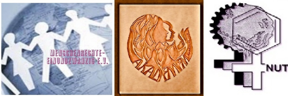
Logo von AG AKAD FM-FM und NUT e. V.

Die Aktivitäten der Arbeitsgruppe AKAD FM-FM vom Menschenrechte-Einundzwanzig e. V. werden von folgenden Institutionen und Behörden finanziert: Ministerium für Kinder, Familie, Flüchtlinge und Integration des Landes Nordrhein Westfalen, Kommunales Integrationszentrum Köln, Zuschüssen aus bezirksorientierten Mitteln der Stadt Köln-Porz, Europäischen Sozialfonds, Diakonie Michaelshoven (Sozialraumkoordination Porz-Mitte/Urbach), House of Resources, Bundesministerium des Innern und für Heimat, Karl-Arnold-Stiftung und Ministerium für Arbeit, Gesundheit und Soziales des Landes Nordrhein Westfalen.